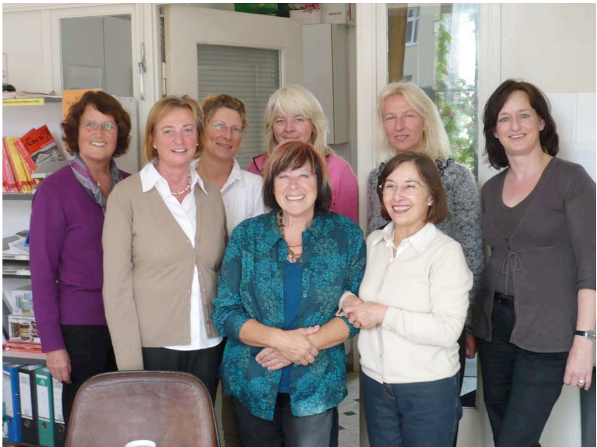
Kieler Ausbildung 2009