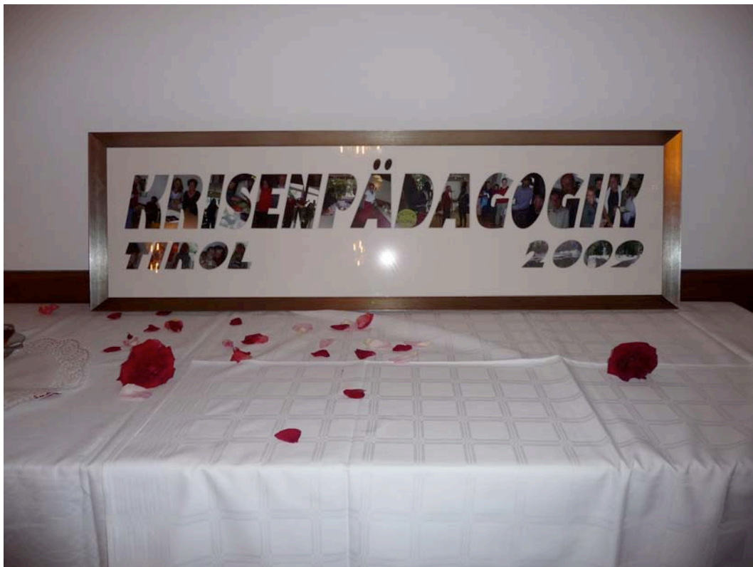
Abschlussfeier der Tiroler Ausbildung 2009 mit dem selbst gemachten Schild