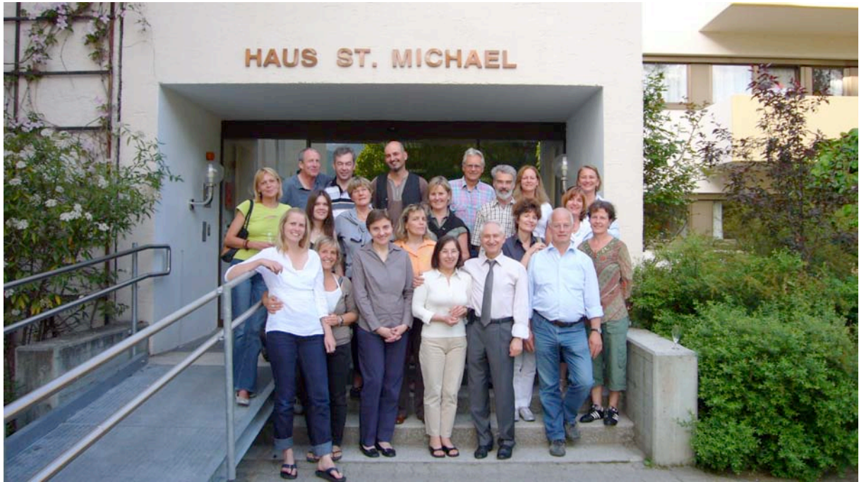
Tiroler Ausbildung 2009